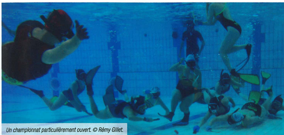
Un championnat particulièrement ouvert.

Le Stade nautique Pierre de Coubertin de Clermont-Ferrand, mis à disposition dans son intégralité par Clermont Auvergne Métropole, a permis le déroulement des championnats de France féminin et masculin en un même lieu. L'ensemble des compétiteurs était satisfait par les conditions offertes : aire de préparation musculaire, terrain plat d'une profondeur de 2 m côté féminin, terrain plat à 2, 50 m côté masculin, zones d'échauffement attenantes et buvette pour la restauration. À cela s'ajoutait la vidéo installée sur le terrain masculin pour